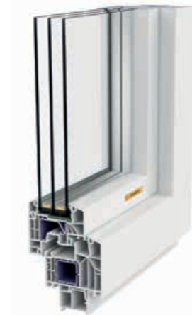
KUNSTSTOFF KUNSTSTOFF-ALU ERGOLINE 85/91

ERGOLINE ist die neue Kunststoff-Fenster-Linie von GAULHOFER. Mit einem U_w -Bestwert von 0,75 (ERGOLINE 85/91) kommen die ERGOLINE Produkte ganz nah an die Besten heran. Für die individuelle Gestaltung können Sie aus zahlreichen Folienfarben auswählen.