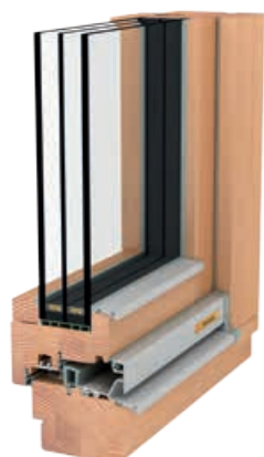
HOLZ NATURELINE 78/92

NATURELINE bedeutet überlegene Fenstertechnik mit natürlichen Materialien. Diese Kombination sorgt für wohligeres Wohngefühl und ökologisch vorbildliche Energiesparlösungen. Starke Bautiefen ermöglichen bislang unerreichte U_w -Werte, die auch auf Dauer halten.