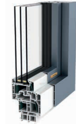
KUNSTSTOFF-ALU ENERGYLINE 85/91 PURE

Die ENERGYLINE setzt als „Klassenbeste beim Energiesparen“ Standards. Das Profil mit PowerDur Glasfaser-Verstärkung kommt ohne Stahlarmierung aus, beugt so Wärmebrücken vor und sorgt für einen U_w -Bestwert von 0,59 W/m 2 K (ENERGYLINE PLUS). Die Aluschale ist in drei verschiedenen Designs erhältlich.