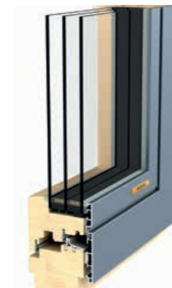
HOLZ-ALU INLINE 91

Mehr Glas, weniger Rahmen: Mit der Produktlinie INLINE präsentiert GAULHOFER ein innen wie außen flächenbündiges Holz-Alu-Fenster mit ausgereifter Bauphysik und erstklassigen Dämmeigenschaften.