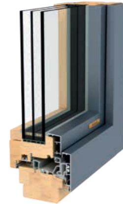
HOLZ-ALU FUSIONLINE 94/108 PURE

FUSIONLINE bietet dank der edlen Materialkombination aus Holz und Alu bestmöglichen Schutz nach außen und natürlich wohligeres Wohngefühl nach innen. Die gänzlich recyclinggerechte Konstruktion kommt dabei ohne zusätzliche Dämmstoffe oder PUR-Schäume aus.